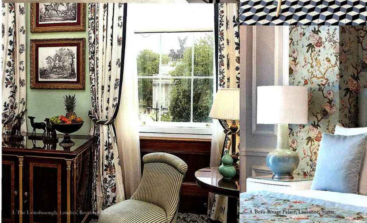
3. The Lanesborough, Londres, Royaume-Uni.