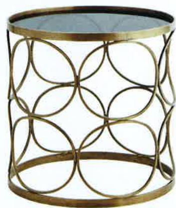
ART DÉCO. Table basse en laiton avec plateau en verre blanc ou fumé, « Stool », Ø 40 cm, H 41 cm, 230 €, Madam Stoltz.

Petit mobilier, tissus et objets rivalisent d'élégance pour faire de votre intérieur un lieu raffiné.