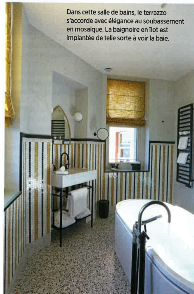
Dans cette salle de bains, le terrazzo s'accorde avec élégance au soubassement en mosaïque. La baignoire en îlot est implantée de telle sorte à voir la baie.