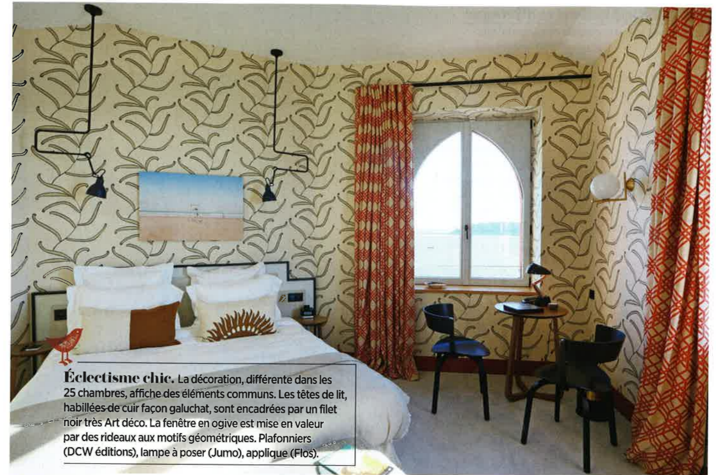
Éclectisme chic. La décoration, différente dans les 25 chambres, affiche des éléments communs. Les têtes de lit, habillées de cuir façon galuchat, sont encadrées par un filet noir très Art déco. La fenêtre en ogive est mise en valeur par des rideaux aux motifs géométriques. Plafonniers (DCW éditions), lampe à poser (Jumo), applique (Flos).