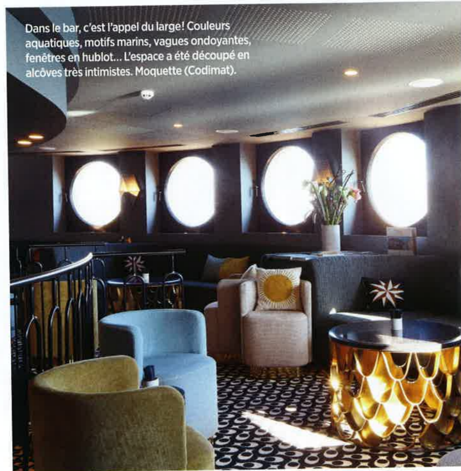
Dans le bar, c'est l'appel du large! Couleurs aquatiques, motifs marins, vagues ondoyantes, fenêtres en hublot... L'espace a été découpé en alcôves très intimistes. Moquette (Codimat).