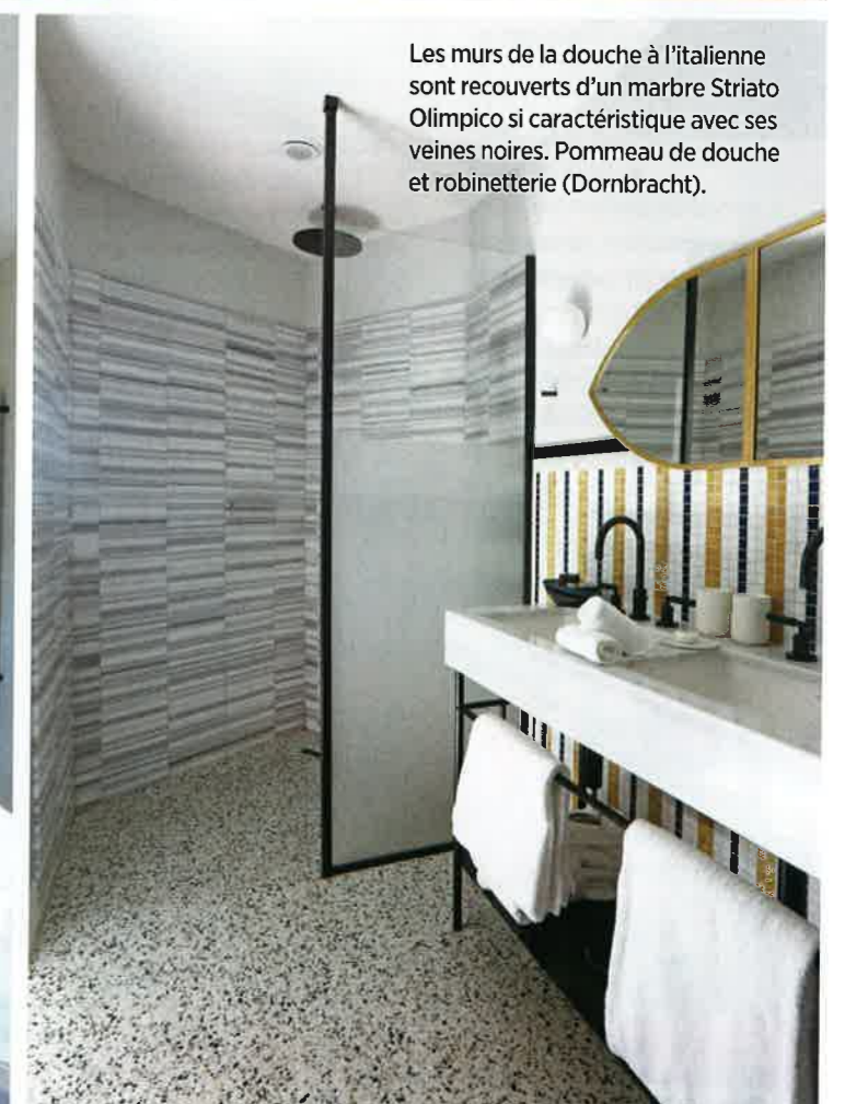
Les murs de la douche à l'italienne sont recouverts d'un marbre Striato Olimpico si caractéristique avec ses veines noires. Pommeau de douche et robinetterie (Dornbracht).