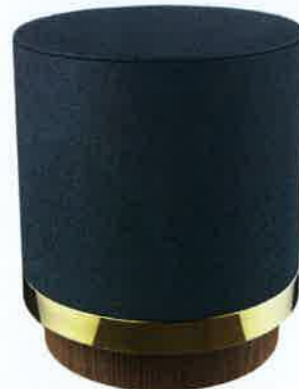
SERTI. Tabouret en chêne et laiton avec revêtement en tissu, H 40 cm, 590 €, Red Edition.