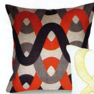
GRAPHIQUES. Coussins « Sausalito », 35 x 35 cm, 54 €, Rouge du Rhin, et « Loop », 33 x 57 cm, 73 €, Iosis.