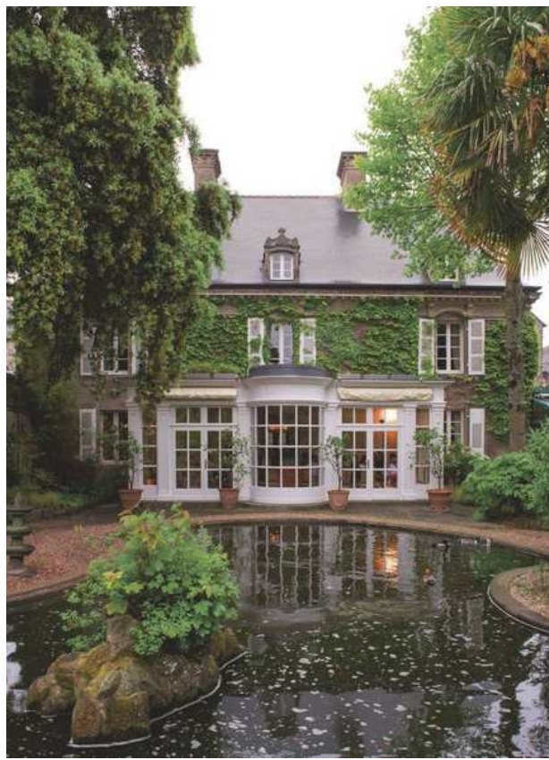
La maison du voyageur. François Goudier/Amandine Schira