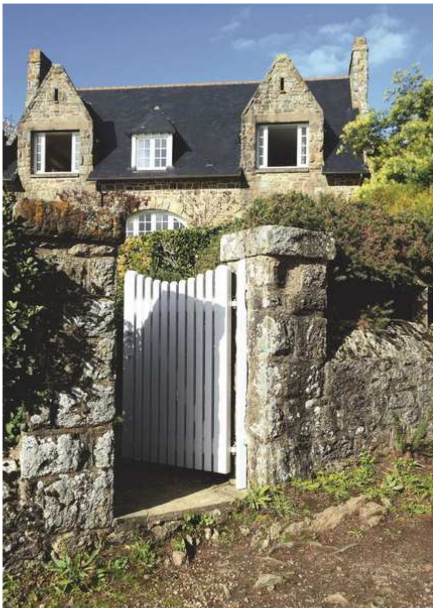
Les Rimains, François Gaudier/Amandine Schiro