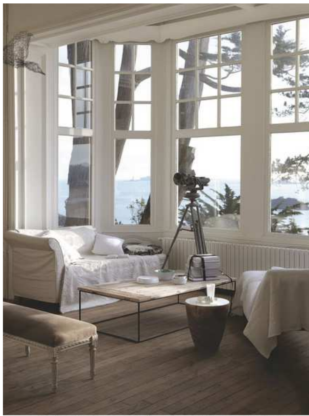
Chez des particuliers, vue imprenable sur la mer.