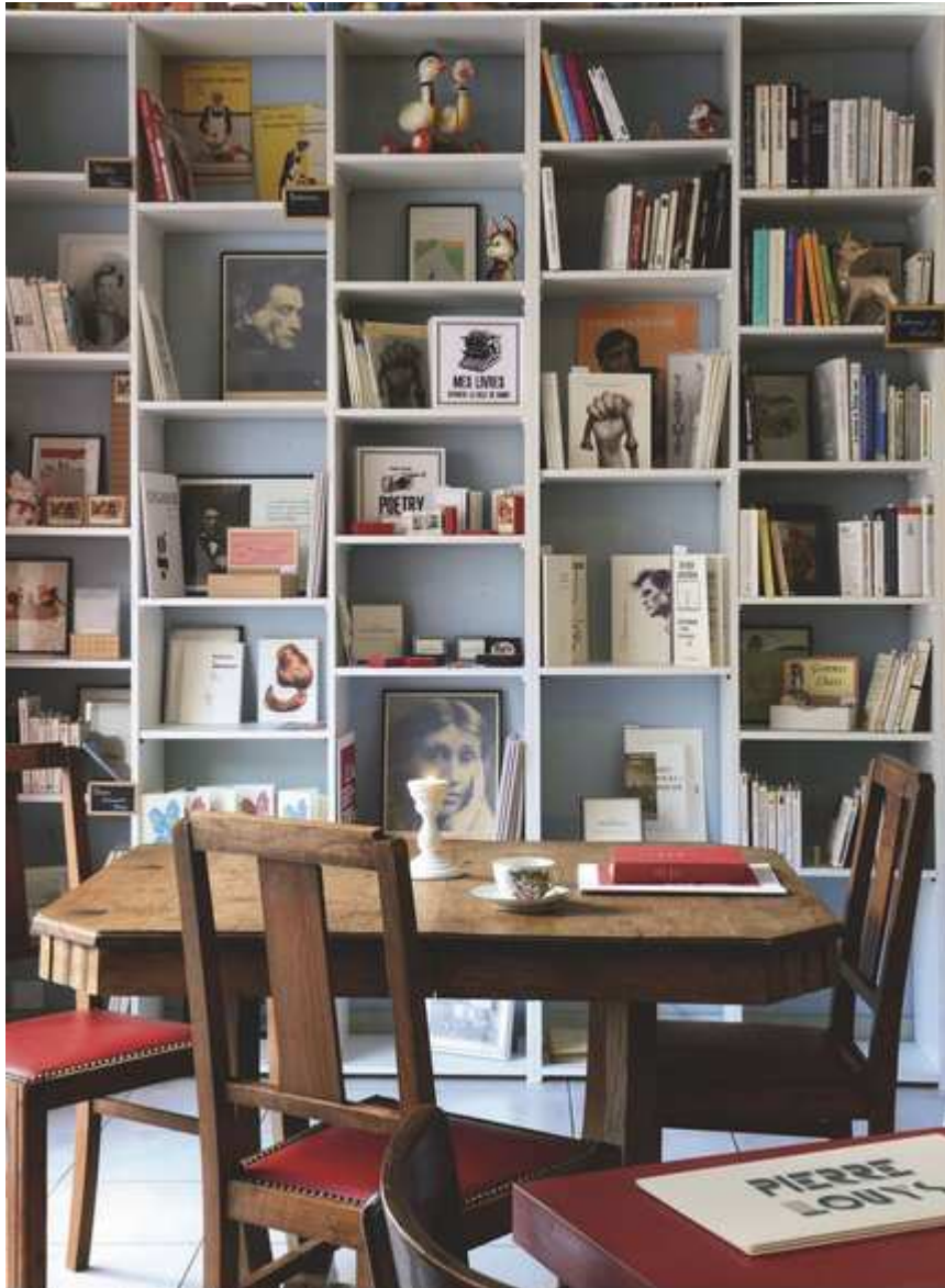
Le Café Bazar. François Goudier/Amandine Schira