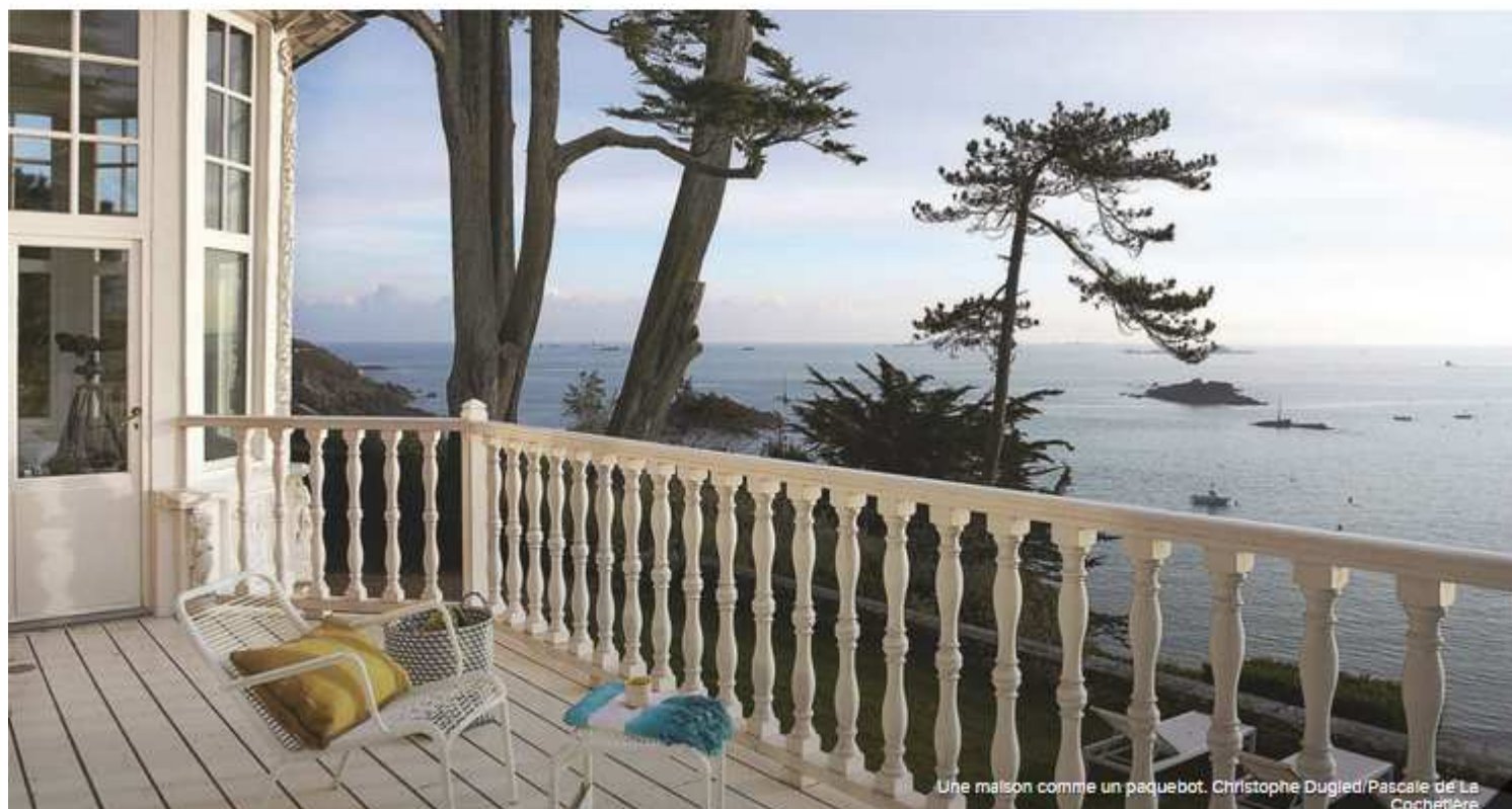
Une maison comme un paquebot. Christophe Dugled / Pascale de La Cochetière

Côte Ouest est parti en week-end... dans le nord de la Bretagne ! L'occasion de vous faire découvrir les bonnes adresses déco et gourmandes de cette jolie région de bord de mer. De Saint-Malo à Cancale en passant par Dinard, visitez en Images la Côte d'Émeraude.