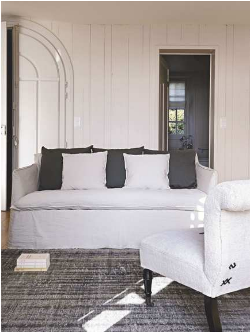
Les Romains. François Goudier/Amandine Schira