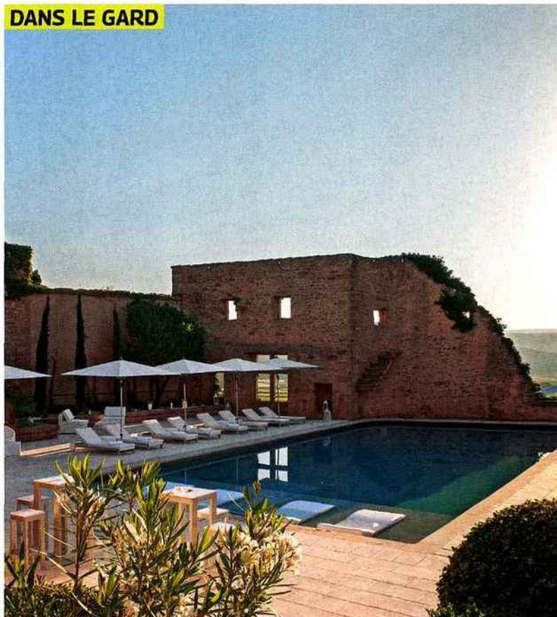
DANS LE GARD

Le Vieux Castillon 10, rue Turion-Sabatier, Castillon-du-Gard (30). www.vieuxcastillon.fr