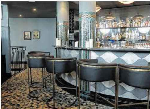
La décoration du bar consacrée au monde sous-marin.