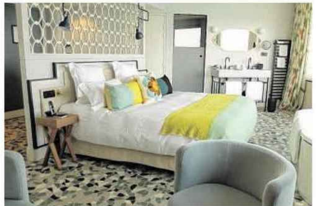
Comptez environ 500 euros pour une chambre et entre 1000 et 1800 euros pour une suite.