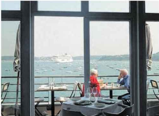
La mer est partout.