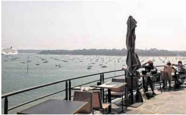
Le restaurant Le pourquoi pas ? en hommage au commandant Charcot est ouvert à toute heure de la journée.