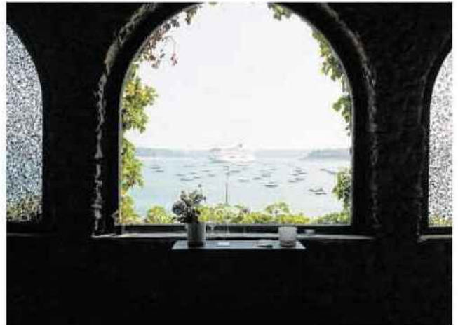
La vue de la chapelle Gabriel.