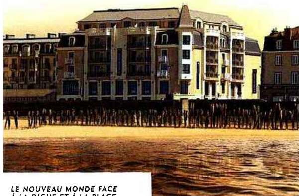
LE NOUVEAU MONDE FACE À LA DIGUE ET À LA PLAGE

64, Chaussée du Sillon – 35400 Saint-Malo Tél. : 02 99 40 40 00 • www.lenouveaumonde.fr Fermé 3 jours en décembre • Ch. à partir de 150 €