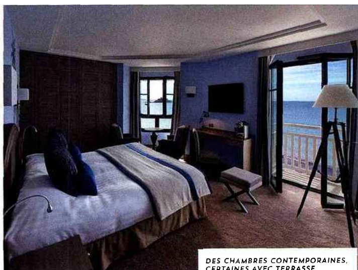
DES CHAMBRES CONTEMPORAINES, CERTAINES AVEC TERRASSE