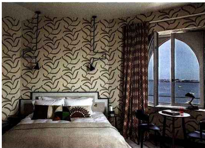
DES CHAMBRES PERSONNALISÉES ET TRÈS RAFFINÉES AU CASTELBRAC, POUR REGARDER LA MER.