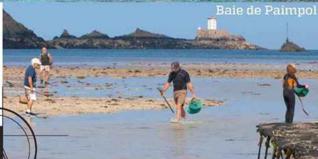
Baie de Paimpol