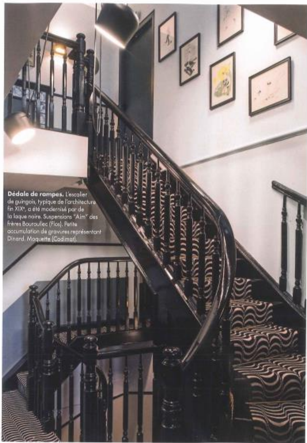
Dédale de rampes. L'escalier de guingois, typique de l'architecture fin XIX e , a été modernisé par de la laque noire. Suspensions "Aim" des frères Bouroullec (Flos). Petite accumulation de gravures représentant Dinard. Moquette (Codmat).

fil conducteur sur les cimaises, la robinetterie, les poignées, les interrupteurs et les encadrements de tête de lit. Autre thématique, le poisson – « j'ai voulu qu'il soit présent sur les portes, les miroirs, les moquettes et les placards », poursuit Sandra. Dans les chambres peintes dans un gris bleu très doux, la décoratrice a décliné panneaux de papier peint – « ils étaient déjà là, dit-elle, et je m'en suis inspirée » –, tissus à rayures ou à motifs végétaux – « n'oublions pas que l'hôtel est entouré de palmiers. »