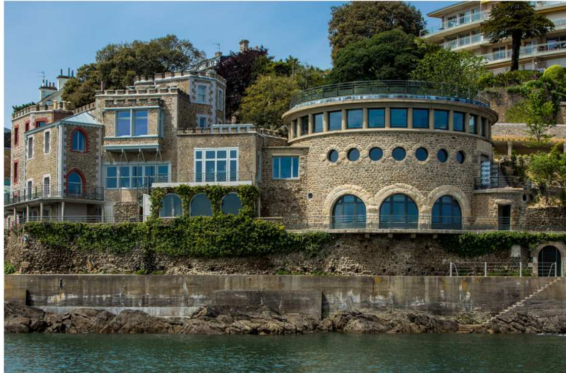
En toutes lettres, le Castelbrac surplombant le rivage