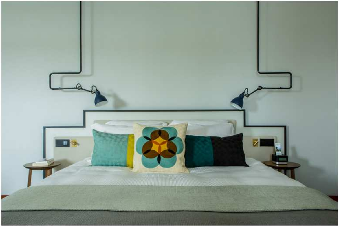
En hommage à la ville "Bric à Brac" surnommée ainsi par le Colonel Hamilton, après avoir trouvé l'aménagement du lieu si curieux