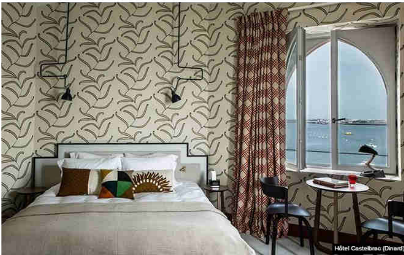
Hôtel Castelbrac (Dinard)