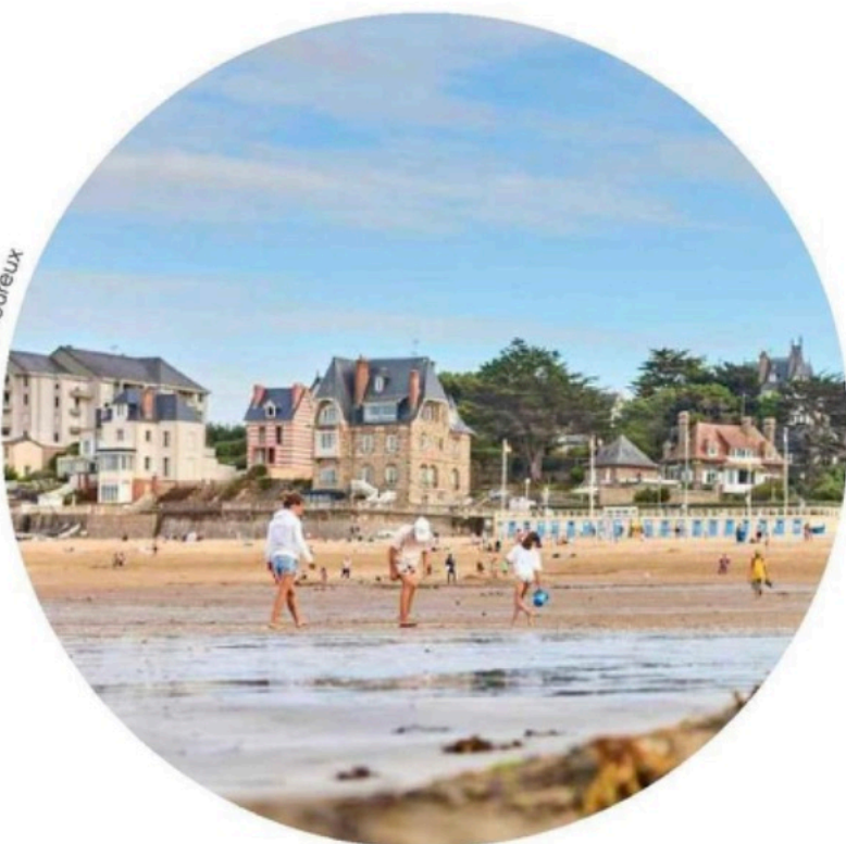
Les plages sont bordées de villas Art déco.

V ille d'art et d'histoire, Dinard offre un trait d'union entre passé et présent. Petit port transformé avec l'essor des bains de mer en destination prisée de l'aristocratie tout particulièrement britannique, cette pépite de la Côte d'émeraude réserve une escapade arty et iodée entre mer et sublimes demeures du XIX e siècle. Pour en prendre le pouls, cap sur son emblématique promenade du Clair de Lune. Longeant le littoral de la pointe du Moulinet à la plage du Prieuré, elle chemine sur environ deux kilomètres,